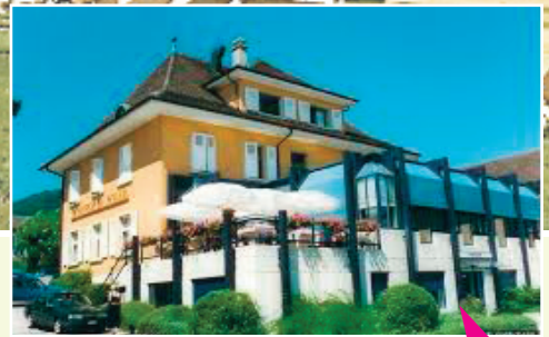
Entrée de la grande salle